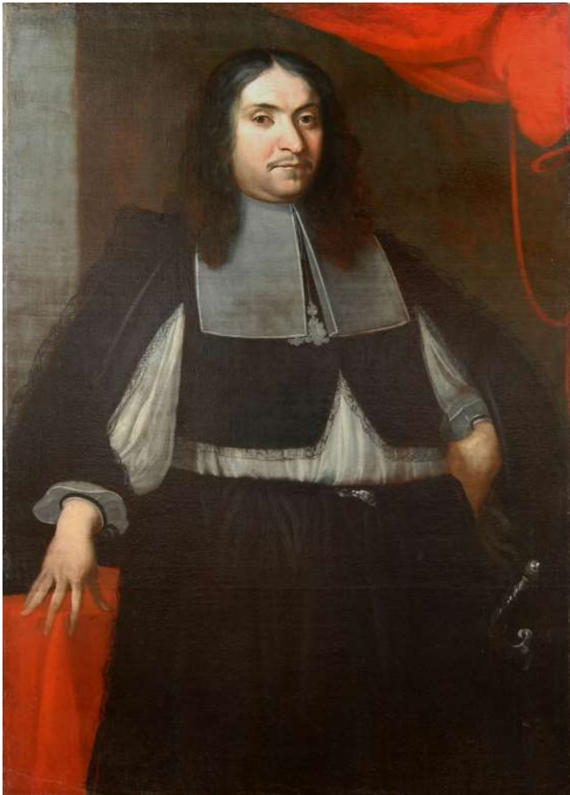
stav po opravě