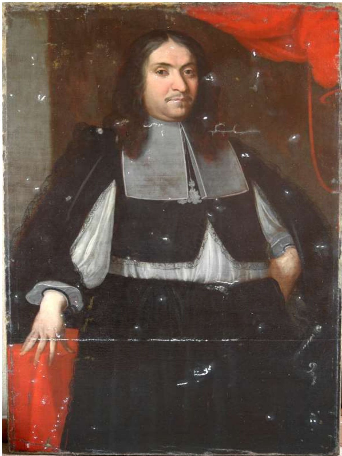
tmelení defektů barevné vrstvy

kvalitní barokní malby. Poté byl obraz opatřen pracovní lakovou mezivrstvou a všechny defekty byly vytmeleny, menší poškození klišo-křídovým tmelem, namáhaná místa pak tmelem voskovým.